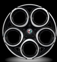
18" disky z lehkých slitin Classico Bi-Colore (Sprint WFL)