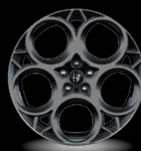
20" disky z lehkých slitin Prototipo (Veloce a Tributo Italiano 1M5)