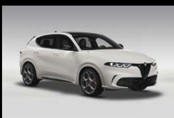
Bílá Alfa + černá střecha (0UX-222) Pouze Tributo Italiano