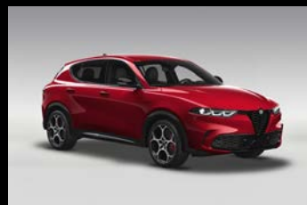
Červená Alfa (1WY-414)