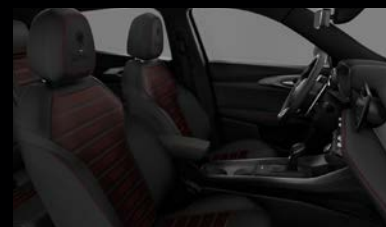
Sedadla v perforované černé kůži s červeným prošíváním a podkresem (Tributo Italiano 508)