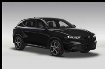
Černá Alfa (6FX-601)