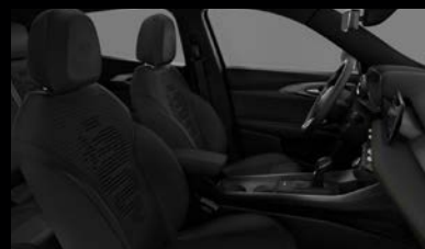
Sedadla v černé látce se znakem Biscione (Sprint 070)