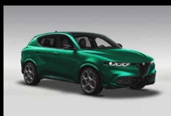
Zelená Montreal + černá střecha (6Y3-041) Pouze Tributo Italiano