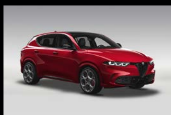
Červená Alfa + černá střecha (6Y2-956) Pouze Tributo Italiano