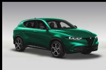
Zelená Montreal (6FW-398)