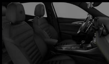
Sedadla v černá perforované kůži (Sprint a Veloce 095)