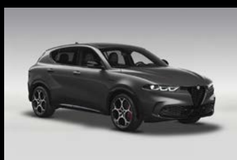
Šedá Vesuvio (3XV-581)