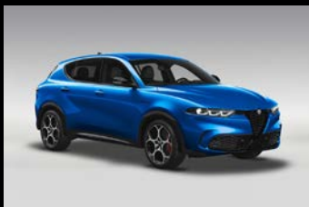
Modrá Misano (3YS-756)