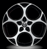
19" disky z lehkých slitin Veloce (Sprint a Veloce 1MJ)