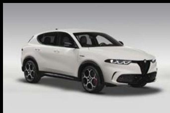
Bílá Alfa (2H6-240)