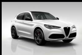
Bílá Alfa + černá střecha (0UX-122) Pouze Tributo Italiano