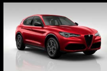
Červená Etna (5ZW-645)