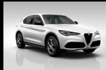
Bílá Alfa (2H6-240)