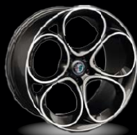
20" disky z lehkých slitin Speciale (Sprint a Veloce WRD)