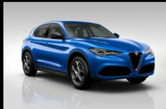
Modrá Misano (5DS-756)