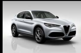
Šedá Moonlight Pearl (61Q-252)