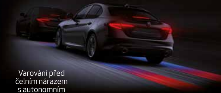
Varování před čelním nárazem s autonomním nouzovým brzděním