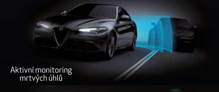
Aktivní monitoring mrtvých úhlů