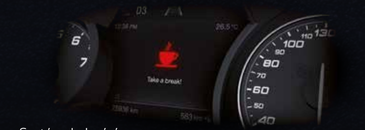
Systém sledování únavy řidiče